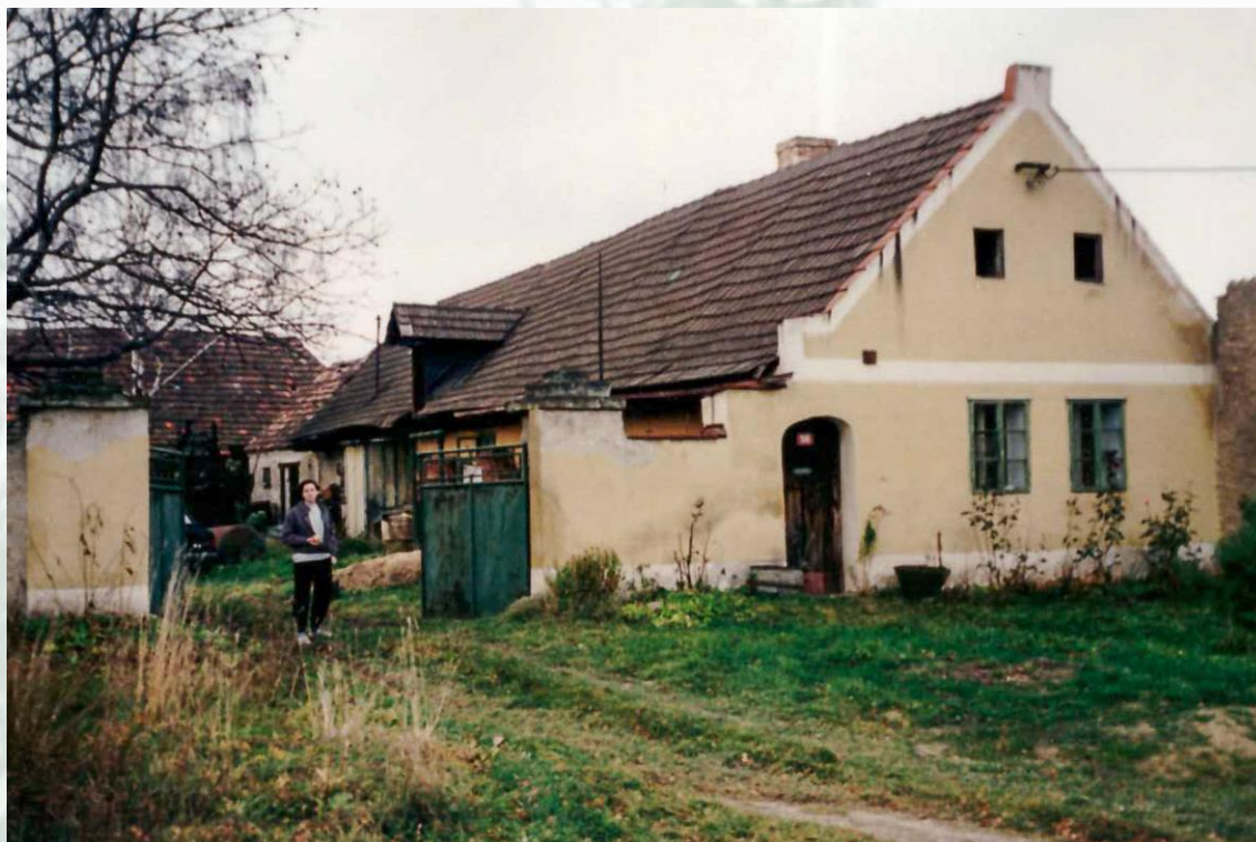
Obrázek 2 – Pohled na statek zepředu – před rekonstrukcí