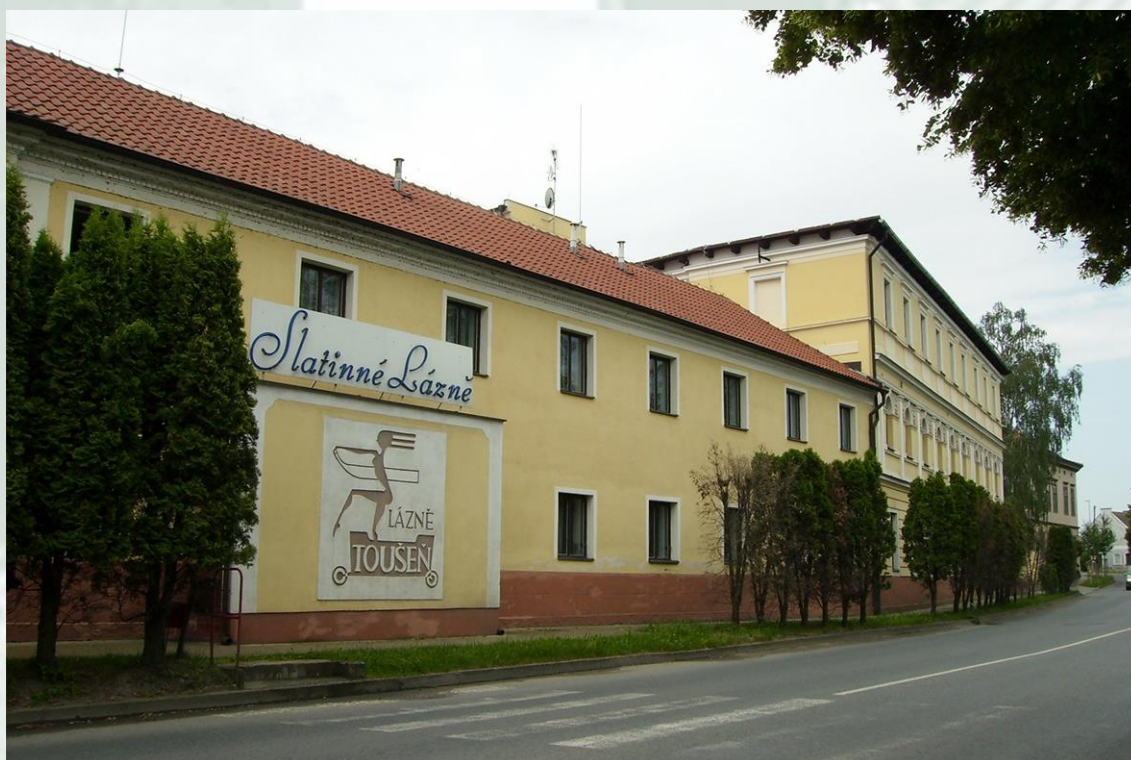
Slatinné lázně Toušeň