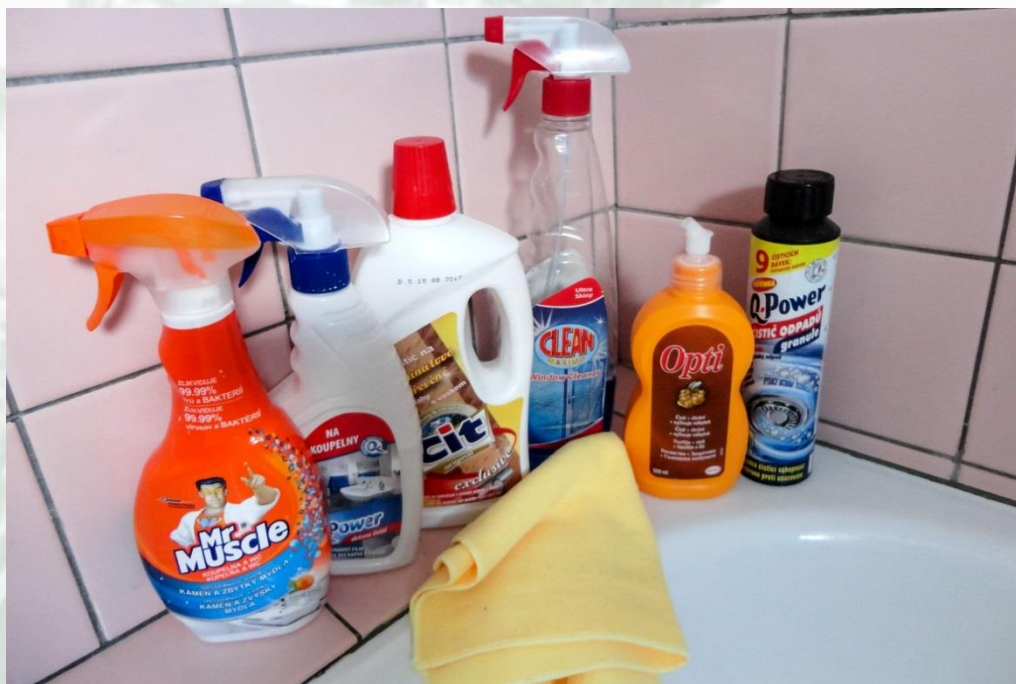
Obrázek 4 – Koupelna