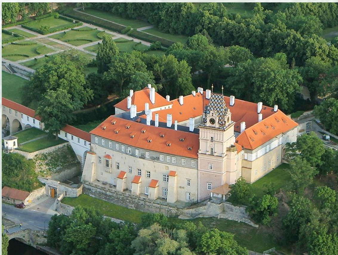
Brandýský zámek z ptačí perspektivy

Zdejší přechod řeky byl významný již od raného středověku, procházela tudy významná cesta z Prahy na sever. První písemná zmínka o něm pochází z roku 1304, kdy se zmiňuje trhovářská ves Brandýs s mostem a kostelem.