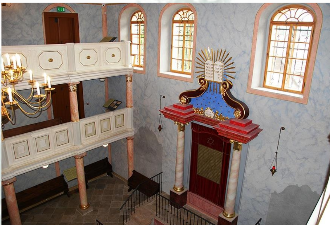
Interiér bývalé synagogy

Od 1. poloviny 16. století sídlila ve městě také významná židovská obec, v 19. století, kdy tvořila 6 % obyvatel. Židovskou komunitu připomíná dnes synagoga z roku 1829 a židovský hřbitov, jeden z nejstarších v Česku.