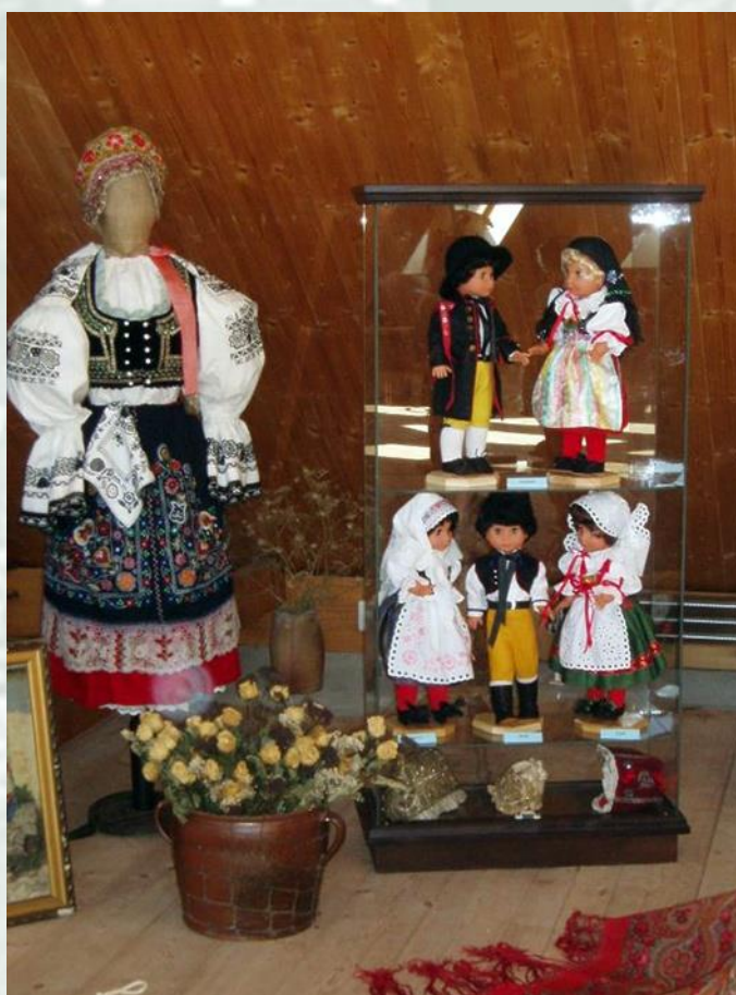
Obrázek 9 – Sběrka panenek v lidových krojích