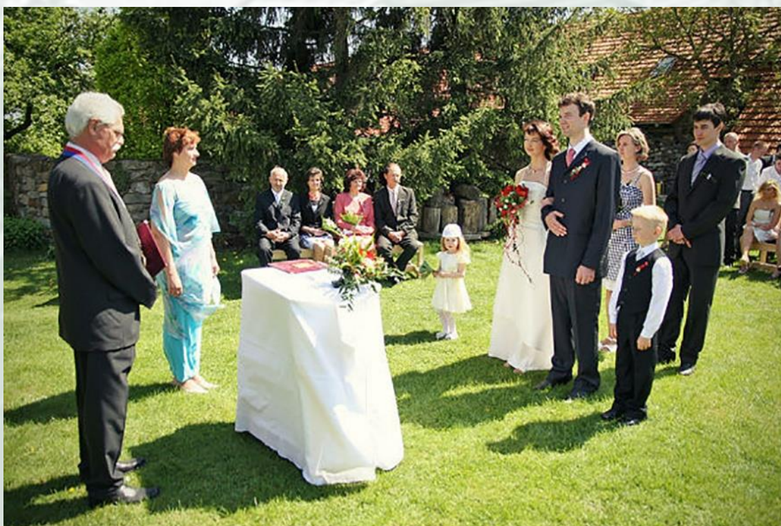
Obrázek 8 – Svatební obřad

Plány se však změnilý. Rekonstrukce dvou rozlehlých domů a stodoly trvala celé roky. V roce 2001 se v Zápech vdávala nejstarší dcera Hany a Michala a tato svatba se stala inspirací pro směr jejich dalšího podnikání. Burdovi začali nabízet nemovitost pro svatební účely, zpočátku se zde konalo pouze 5 svateb ročně. Po další adaptaci interiérů a přilehlé zahrady zájem rostl. Tou dobou domy v létě ještě využívali klienti z Holandska. Před dvěma roky se Hana s Michalem zaměřili pouze na svatební klientelu, v současnosti se koná na statku v Zápech okolo 30 svateb ročně.