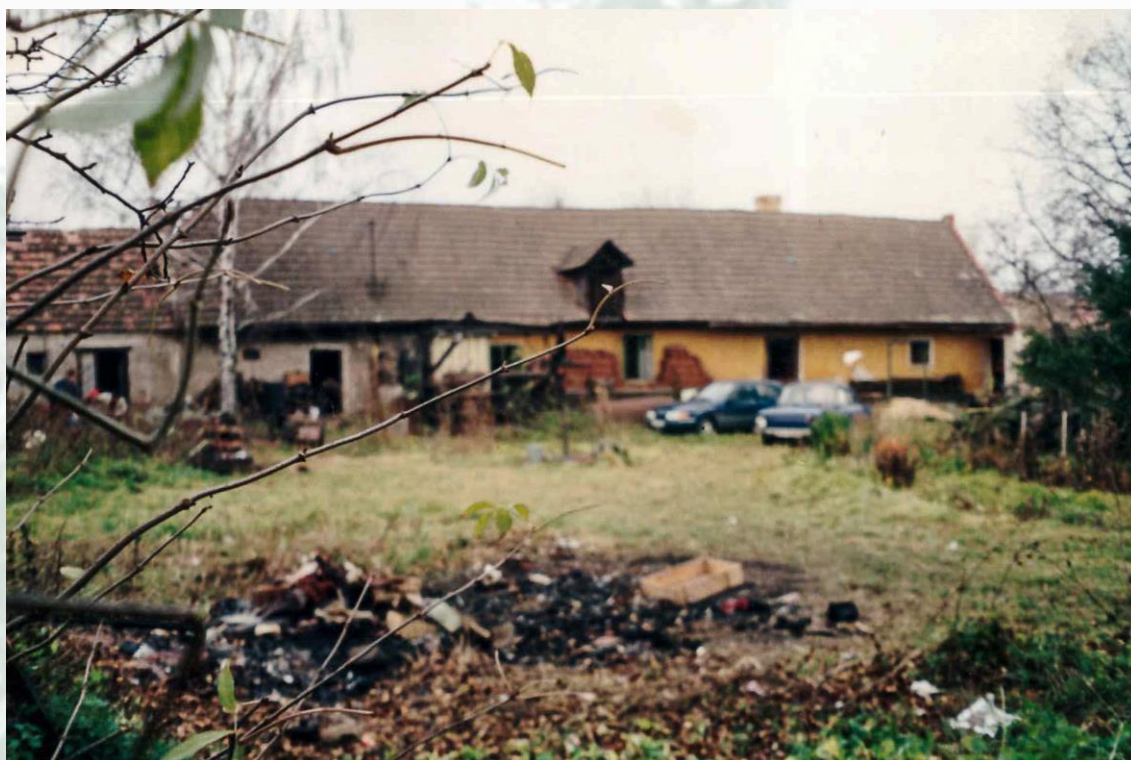
Obrázek 4 – Boční pohled na statek – před rekonstrukcí