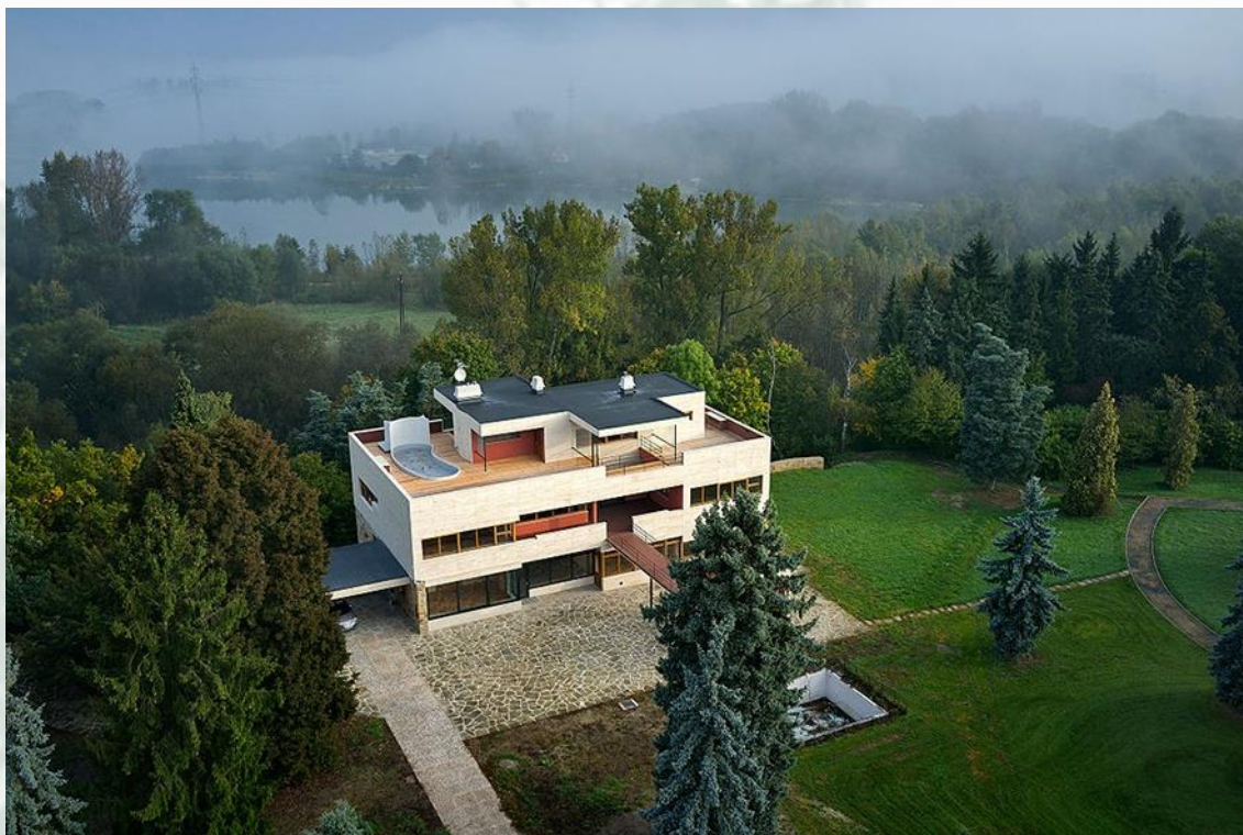
Funkcionalistická stavba, tzv. Volmanova vila

Návštěvníkům doporučujeme naučnou stezku v délce 21 km http://www.celakovice.cz/cs/informace/naucna-stezka/