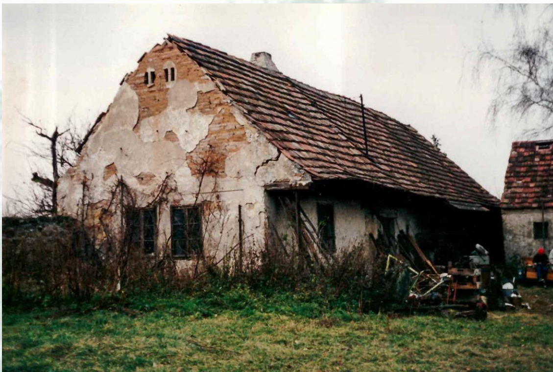
Obrázek 6 – Pohled ze dvora – před rekonstrukcí