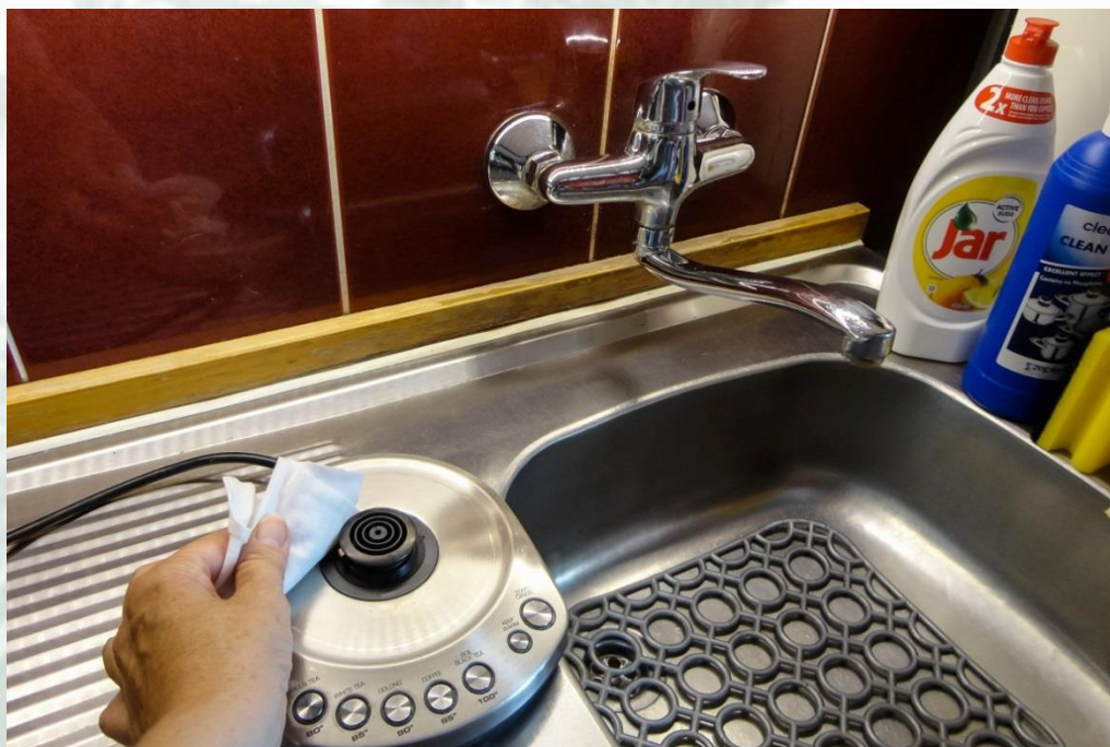
Obrázek 2 – Kuchyně