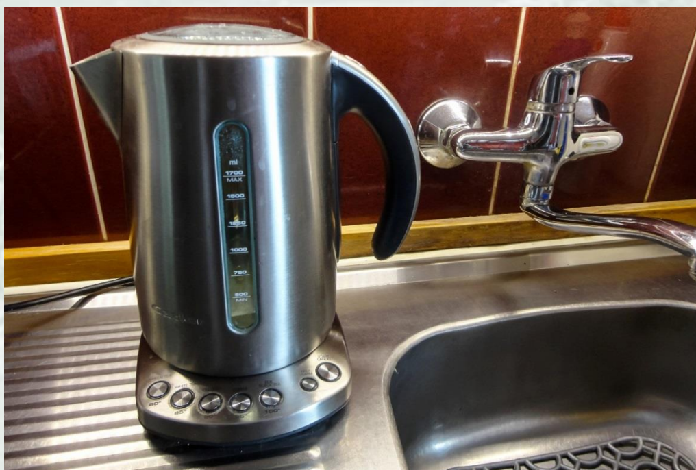
Obrázek 3 – Konvice