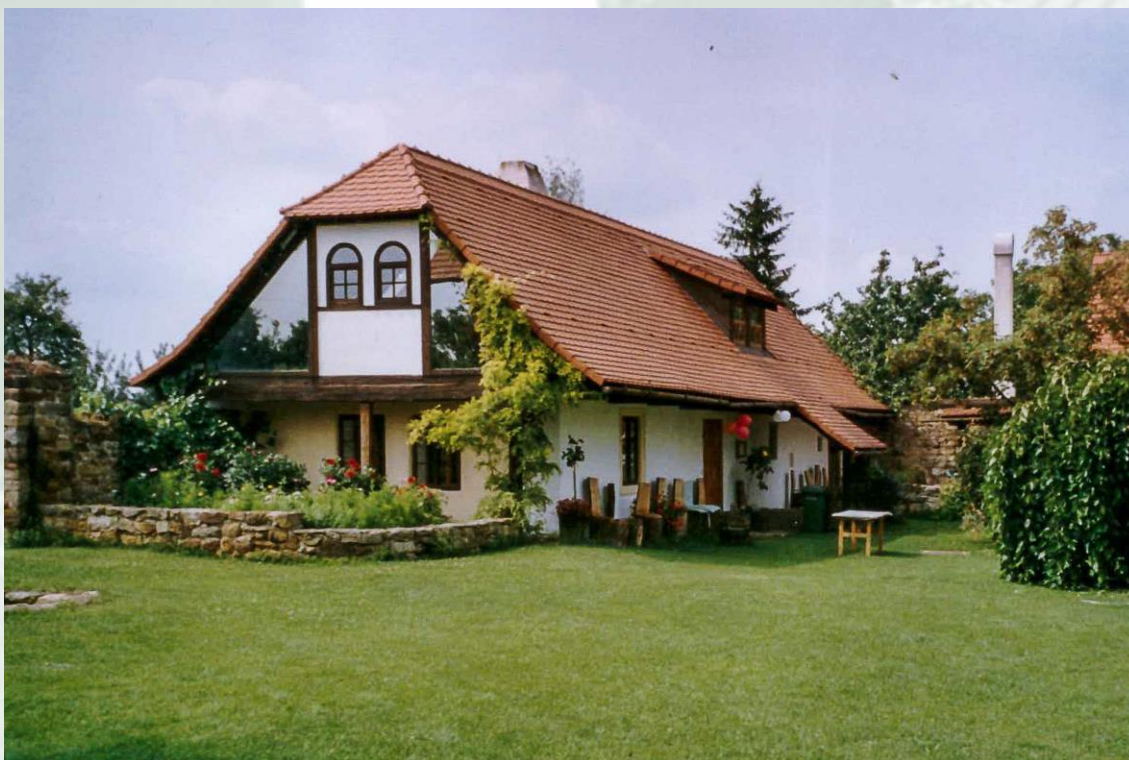
Obrázek 7 – Pohled ze dvora – po rekonstrukci