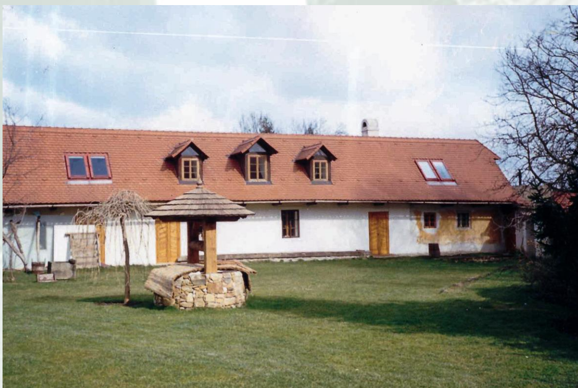
Obrázek 5 – Boční pohled na statek – po rekonstrukci