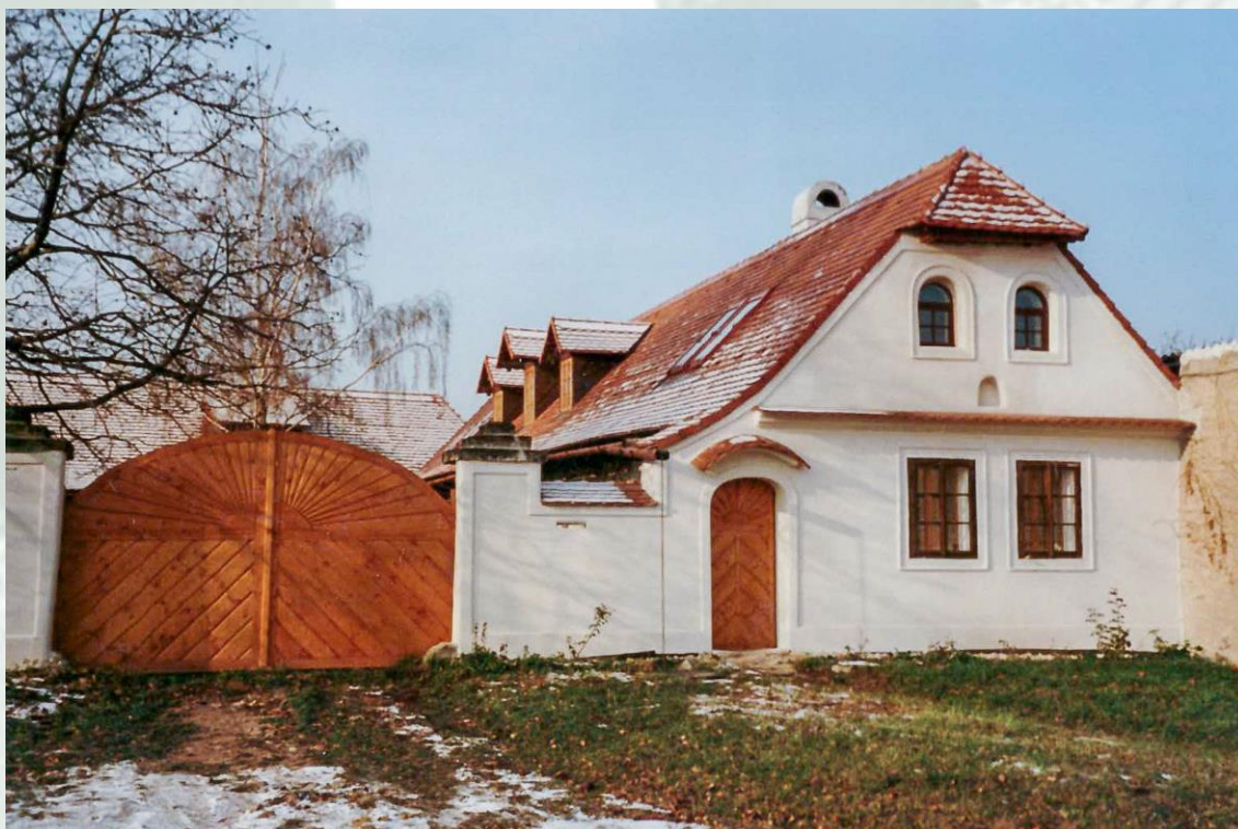
Obrázek 3 – Pohled na statek zepředu – po rekonstrukci