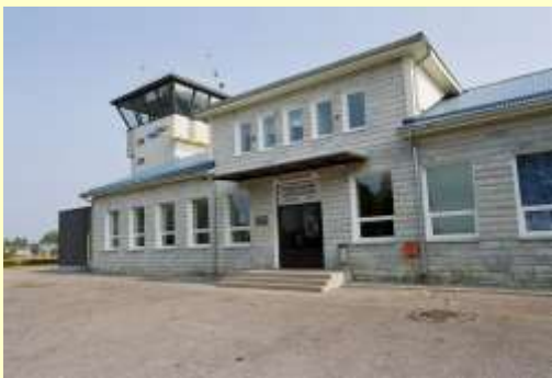
Sõiduautoga 226 km